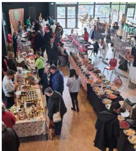
(1) : Portes Ouvertes aux Artistes Beaucouzéens (2) : Comité des Fêtes