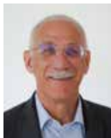
YVES COLLIOT Maire