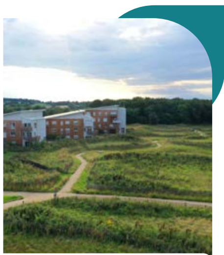
Photo de "La forêt qui pousse" en 2020