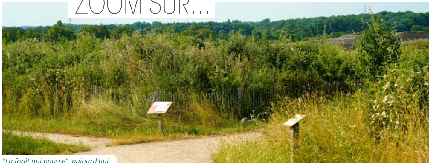
"La forêt qui pousse", aujourd'hui