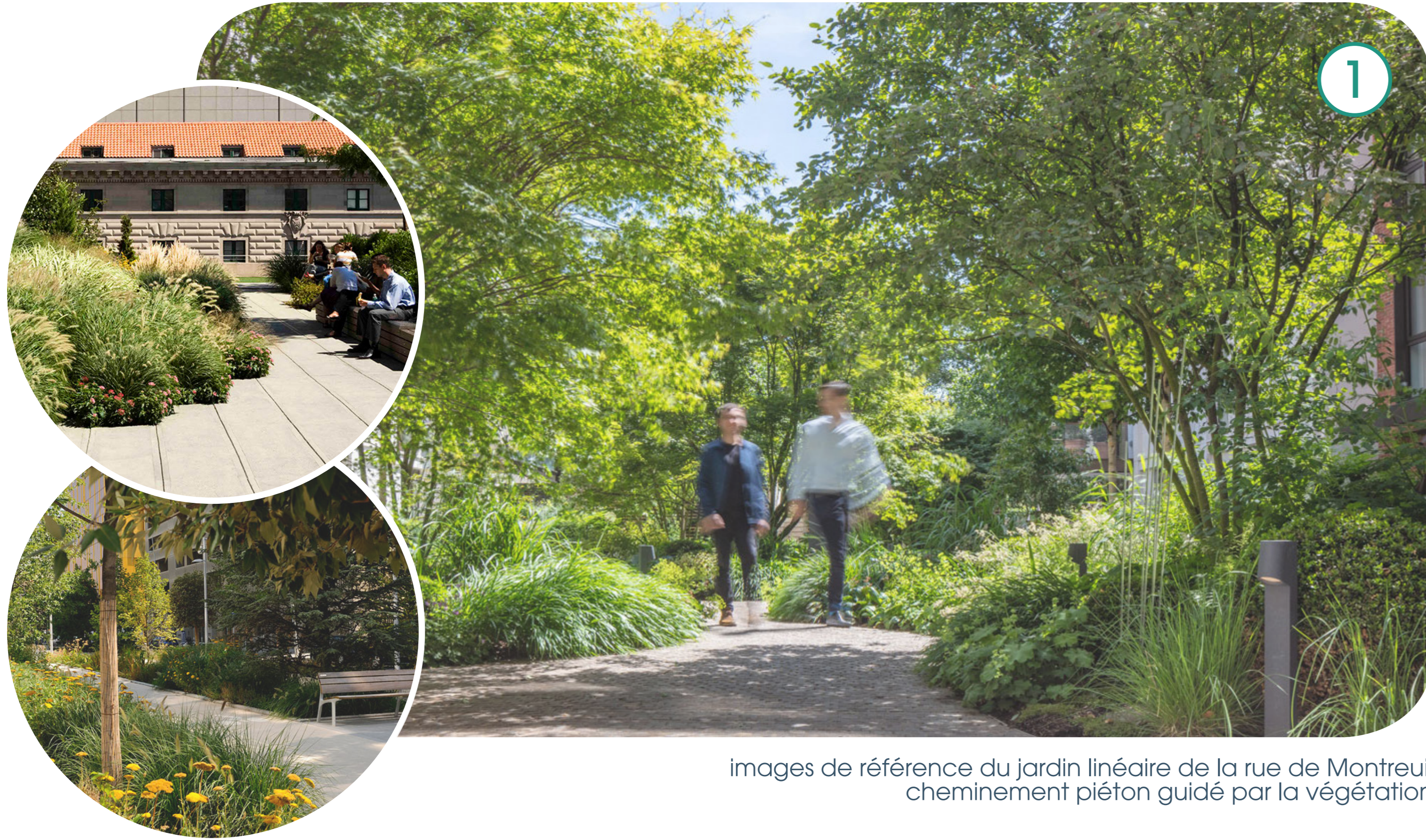
images de référence du jardin linéaire de la rue de Montreuil cheminement piéton guidé par la végétation