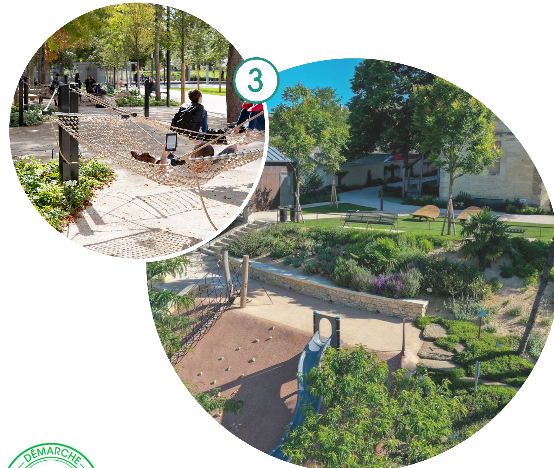
images de référence de mobiliers de détente et de récréation