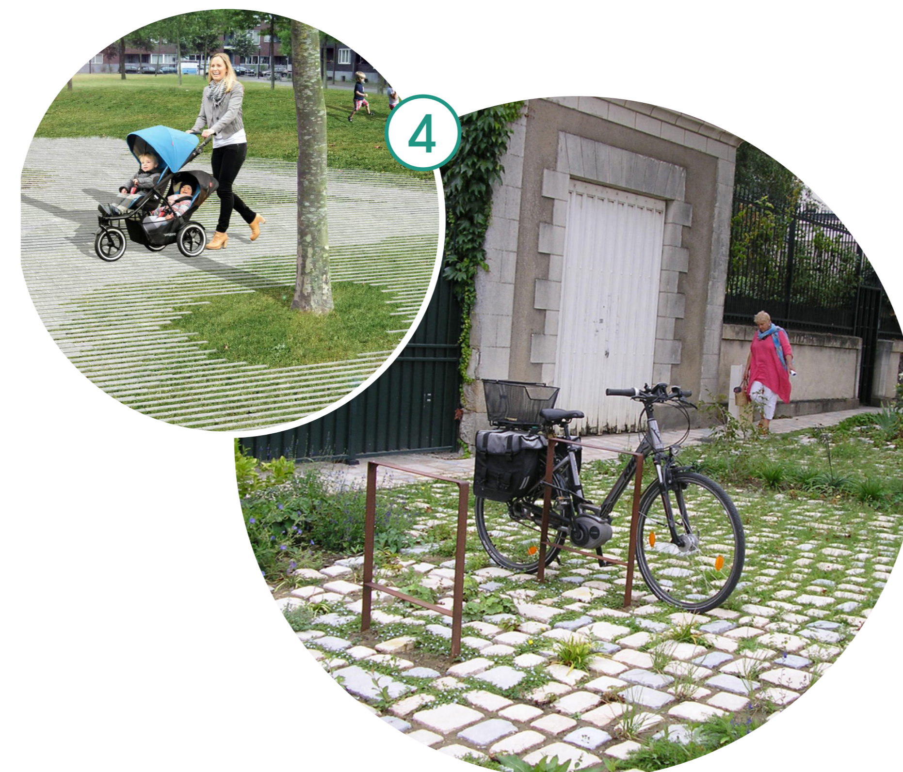
images de référence de revêtements en pavés enherbés