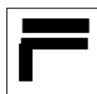
Tourner à droite