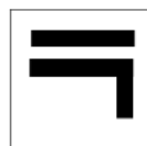
Tourner à gauche