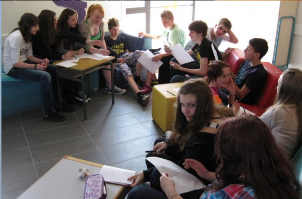
Avec la participation de la Mission Jeunesse - Aînés